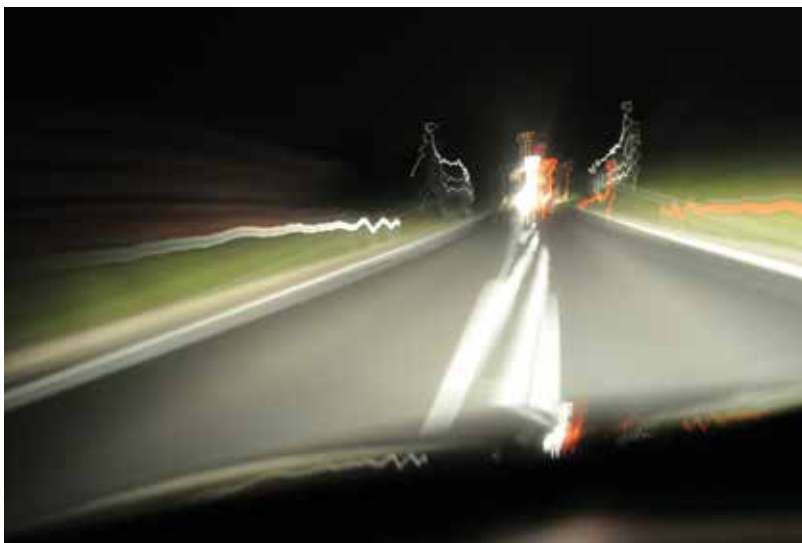
Ja putujem ponesena maštom - Io viaggio trasportata dalla fantasia

cità d'otturazione fa sì che i soggetti nella parte centrale della composizione siano più o meno nitidi, e quelli in prossimità agli orli foschi. Silena usa coscientemente gli effetti di questa tecnica anche nella fotografia Tu viaggi nella quotidianità affinché l'osservatore abbia la sensazione di essere anche lui stesso in movimento.