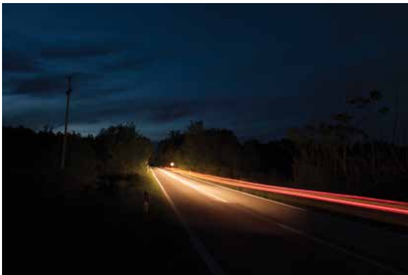
Ti putuješ tragovi ostaju - Tu viaggi, le tracce restano